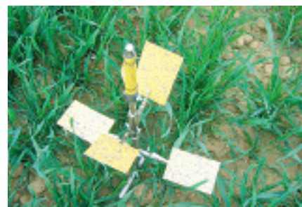
Abb. 2: Belag des von der Fa. agrotop positionierten Water Sensitive papers im Versuch