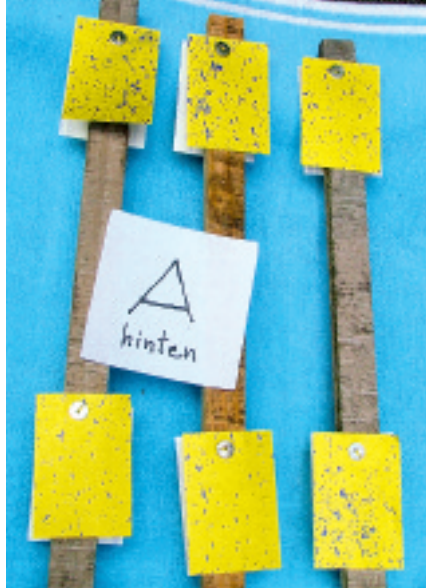
Abb. 4: Benetzung auf der Rückseite der Pflanze

Feldspritzgerät: Hardi 800 l, Balkenbreite: 15 m, Düse: Turbo Drop Hi-