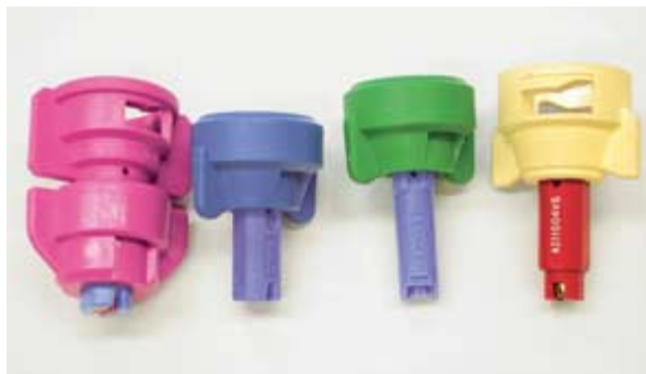
Lange Injektordüsen der ersten Generation, wie agrotop TurboDrop, Albus AVI, Lechler ID oder TeeJet AI arbeiten in höheren Druckbereichen von ca. 2 bis 8 bar.