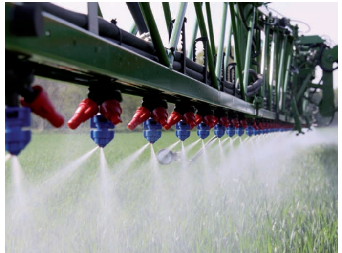
Dank Doppelfachstrahltechnik läßt sich die Anlagerung der Mittel an die Pflanzen verbessern.

Die herkömmlichen Möglichkeiten zur Leistungssteigerung sind im Bereich Pflanzenschutz weitgehend ausgereizt. So gibt es für Behältervolumen und Gestänge-Arbeitsbreiten technisch und organisatorisch bedingte Obergrenzen, die viele Betriebe bereits erreicht haben. Doch die Suche nach Möglichkeiten zur Kosteneinsparung und Leistungssteigerung geht weiter, und so dreht sich die Diskussion derzeit vor allem um ein Thema: Reduzierte Wasseraufwandmengen und höhere Fahrgeschwindigkeiten. Mit Wassermengen von z. B. 150 l/ha und 12 km/h kann man die Schlagkraft weiter erhöhen, zugleich lassen sich Arbeitszeit und Kraftstoff sparen. Vielerorts gibt es Praktiker, die positive Erfahrungen damit gemacht haben, doch gesicherte Erkenntnisse liegen bislang nicht vor.